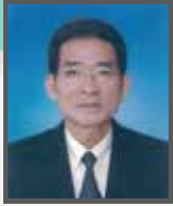
รศ.ดร.โกรรุทธิ เกียรติโกมล ประธาน สอ.มจร.